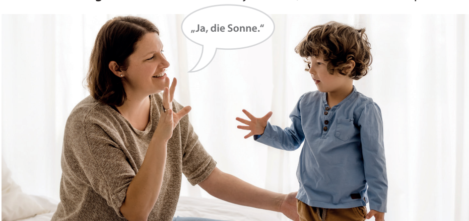
Gebärde für Sonne