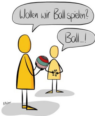
Das Kind sagt das Wort „Ball“ und gebärdet das Wort „spielen“ und sagt somit die Zwei-Wort-Kombination „Ball spielen“.

Wenn Kinder bereits einzelne Wörter sprechen können, helfen ihnen die Gebärden, ihre Wünsche, Bedürfnisse und Interessen besser mitzuteilen: