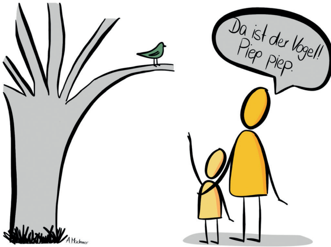
Kind zeigt auf den Vogel, um auf diesen aufmerksam zu machen.

Gesten und Gebärden sind natürliche Ausdrucksweisen, die eng mit dem Spracherwerb verbunden sind. Bevor Kinder Wörter sprechen, drücken sie sich mit ihrer Körpersprache, Gestik und Mimik aus. Zum Beispiel verwenden sie die Zeigegeste, um auf etwas aufmerksam zu machen oder um einen Gegenstand zu bekommen.