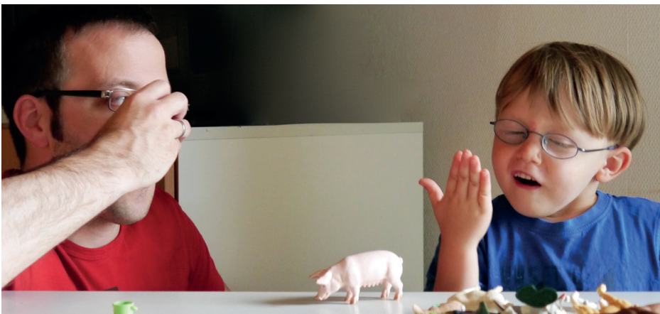
Gebärde für Schwein

Miteinander zu sprechen und gleichzeitig Gebärden zu verwenden, bereitet Erwachsenen und Kindern Freude und beide verstehen ihr Gegenüber besser. Zudem können sich die Kinder besser mitteilen. Dies sind die wichtigsten Voraussetzungen für einen erfolgreichen Spracherwerb.