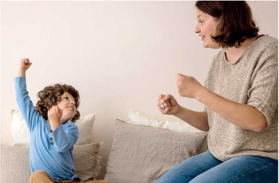
Gebärde für Auto