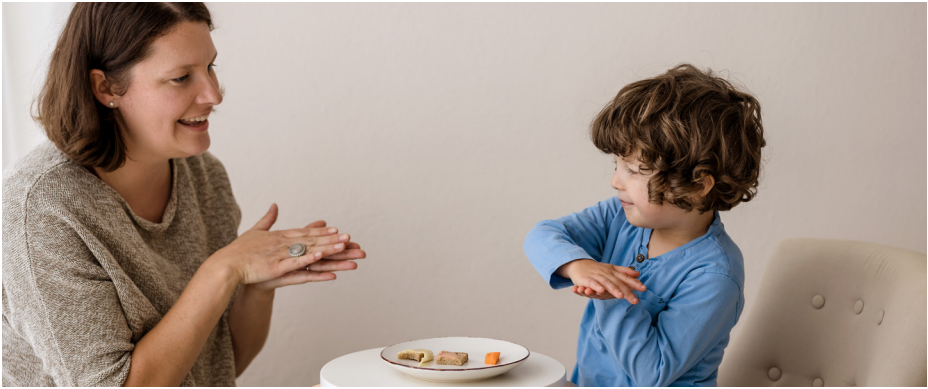
Gebärde für Käse

Jedes Kind profitiert von LUG. Besonders wichtig sind die Gebärden jedoch für Kinder, die deutlich später anfangen zu sprechen als andere Kinder und somit über lange Zeit wenige Möglichkeiten haben, sich auszudrücken.