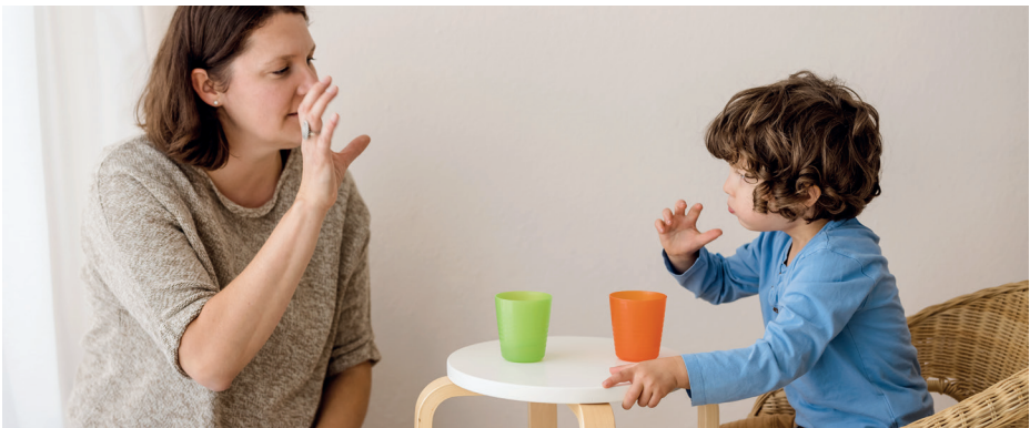
Gebärde für trinken