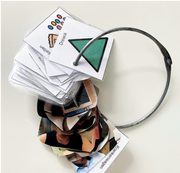
Ring mit Fotos und Piktogrammen eines fünfjährigen Kindes mit DS22q11. Die Fotos und Piktogramme können entsprechend seiner aktuellen Interessen ausgetauscht werden. Er kann den Ring überall mit hinnehmen und dadurch leichter ein Gespräch mit anderen beginnen und führen.